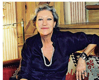
Designer Elsa Peretti e a destra il celebre cuore di Tiffany & Co.

MILANO — Lei non si rende conto che «quel cuore» per ogni ragazzo/a italiano/a è fra i regali più amati. Le racconti delle code fuori dalla boutique nei giorni delle feste comandate e ti guarda come se stessi parlando di qualcun altro. Lei è Elsa Peretti, già la donna che sta dietro alla seconda vita di successo griffata Tiffany. Un mito per gli americani. E non solo. Perché fu lei, 35 anni fa, a credere nel «brillante democratico» (costava nel '74 89 dollari, era una pietra da 5 punti montata sull'argento!), nel «gioiello alla portata di tutte le donne», nel «sogni che non devono sempre restare tali» («Per esempio, l'argento. Io l'ho fatto anche perché sta bene alle bruno, come me!»). Un «compleanno» che festeggerà oggi a Milano con un