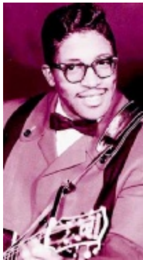
Bo Diddley a sinistra in un'immagine giovanile e a destra in concerto nel 2006